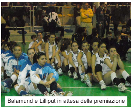
Balamund e Lilliput in attesa della premiazione

La sfida per il terzo posto se l'è aggiudicata invece il Calton Montanaro al termine di cinque set contro il Lasalliano. Quinto il Chisola, sesto posto per il Collegno Cus.