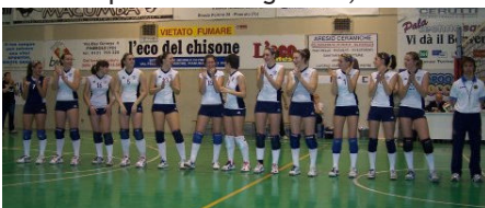
L'InVolley, protagonista in finale con il Balamund