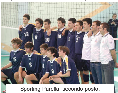
Sporting Parella, secondo posto.