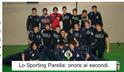
Lo Sporting Parella: onore ai secondi.

PINEROLO - L'unione fa la forza. Dravelli e Arti e Mestieri si aggiudicano il titolo provinciale Under 16 Maschile superando in finale lo Sporting Parella. Una vittoria in salita per i biancoblu, partiti in svantaggio nella prima frazione salvo poi recuperare con tre set praticamente perfetti. Una conferma di due concetti base: il primo, evidente, è che la programmazione porta risultati importanti, visto che parte della squadra vincitrice è formata da giocatori che lo scorso anno si sono aggiudicati il titolo Under 14 regionale. Il secondo, importante, è che l'unione dei migliori talenti di ogni squadra alza inesorabilmente il livello medio delle forze in campo. Rammarico per il Parella, sconfitto nella seconda finale provinciale consecutiva dopo quella Under 18: ma c'è ancora la fase regionale per prendersi le giuste soddisfazioni.